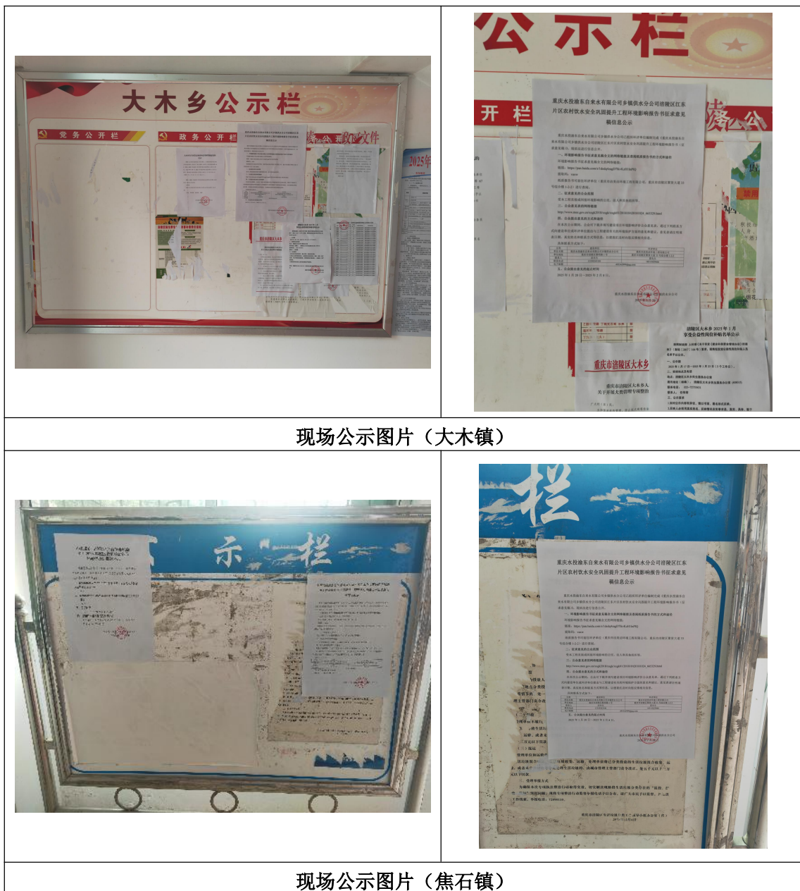
现场公示图片（大木镇）