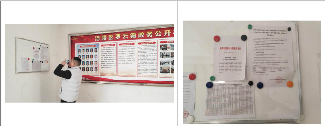
现场公示图片（罗云镇）