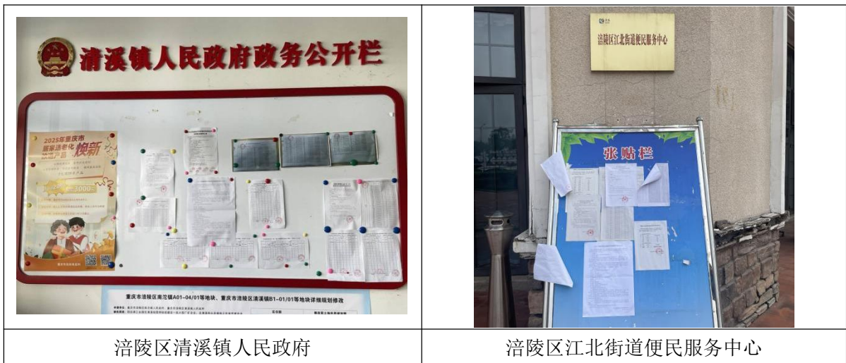
涪陵区清溪镇人民政府

建设项目征求意见稿编制完成后，2025 年 9 月第二次网络公示期间，为使项目所在地的公众更好地了解本项目，建设单位在沿线乡镇张贴公示，张贴公示内容与第二次网络公示内容一致。现场张贴公示照片见图 3.2-5。