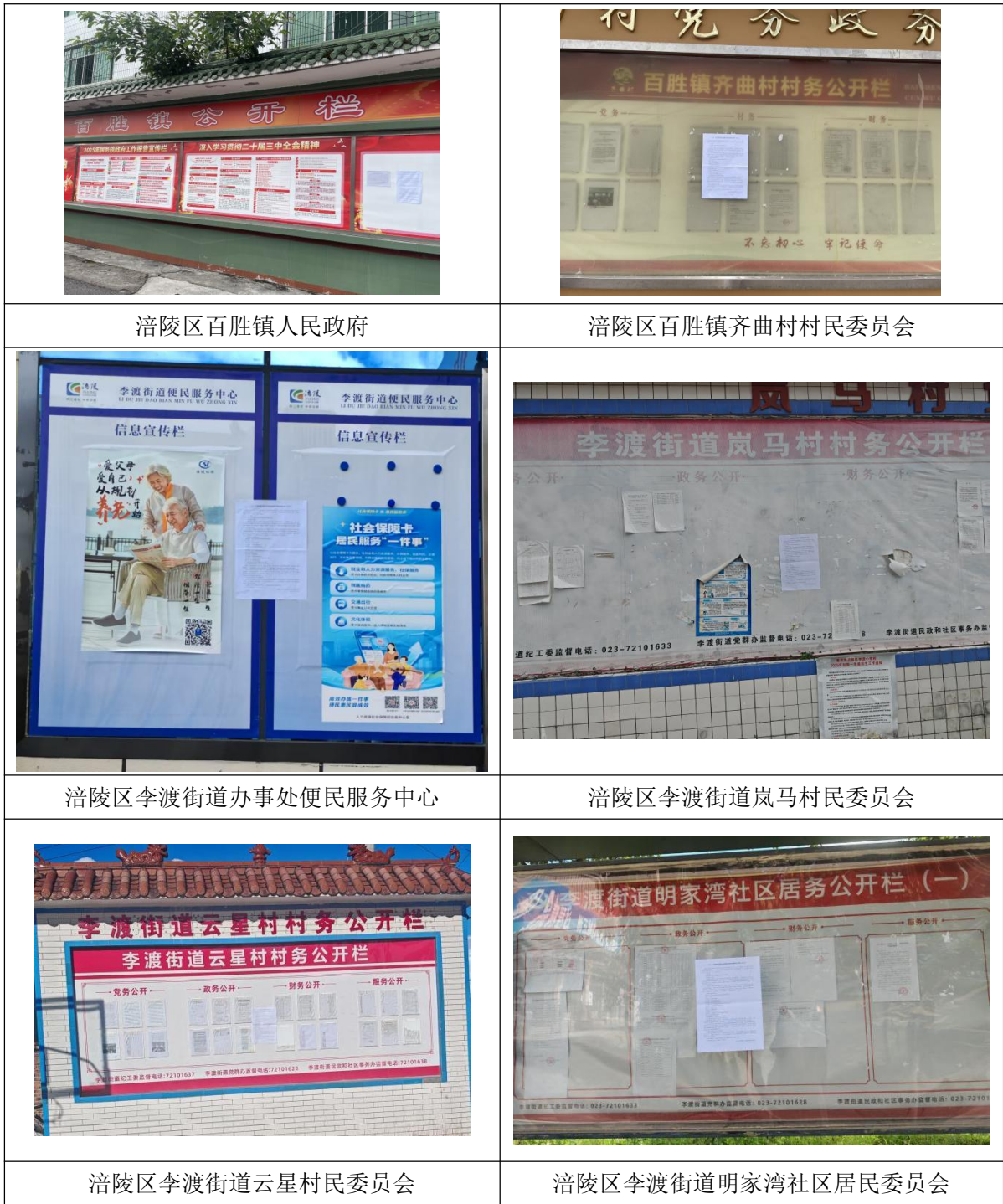
图 3.2-5 当地张贴公示现场照片