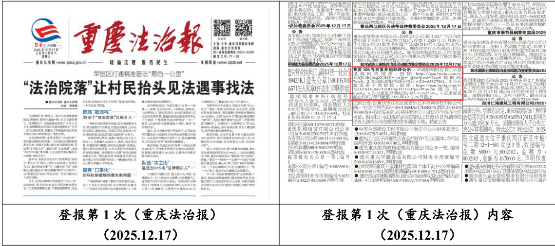
图 3.2-2 征求意见稿报纸登报公示 (第一次)

2025年12月17日，我单位在征求意见的10个工作日内，在重庆法制报对本项目环境影响评价相关信息进行了2次公示，符合《环境影响评价公众参与办法》(生态环境部令 第4号)相关要求。