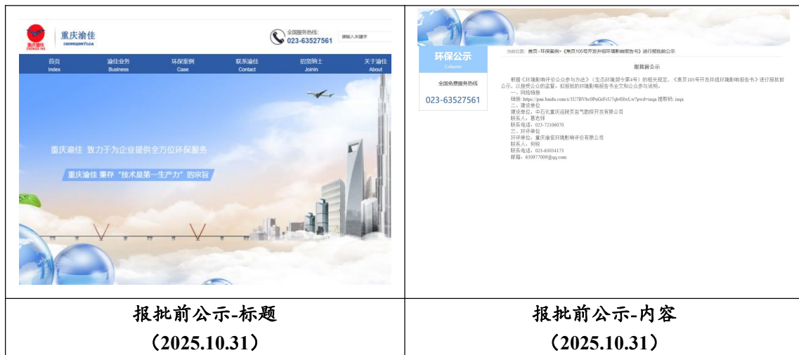
图 6.2-1 报批前公开（网络公示）

载体选取符合性分析：重庆渝佳环境影响评价有限公司“环保案例” (http://www.cqyjpc.cn/index) 进行公众参与报批前公示，该网站备案证号： 渝 ICP 备 15012915 号-1, 为重庆渝佳环境影响评价有限公司对外公开门户 网站，为符合要求的正规公开网站，符合《环境影响评价公众参与办法》 (生态环境部令第 4 号) 相关要求。