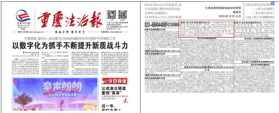
图 3.2-3 征求意见稿报纸登报公示 (第二次)