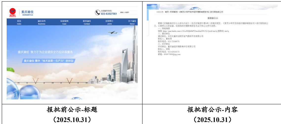
图 6.2-1 报批前公开（网络公示）

载体选取符合性分析：重庆渝佳环境影响评价有限公司“环保案例” ( http://www.cqyjpc.cn/index )进行公众参与报批前公示，该网站备案证号： 渝 ICP 备 15012915 号-1,为重庆渝佳环境影响评价有限公司对外公开门户 网站，为符合要求的正规公开网站，符合《环境影响评价公众参与办法》 (生态环境部令第4号)相关要求。