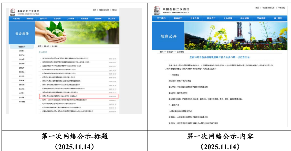
图 2.2-2 首次环境影响评价信息公开（网络公示）