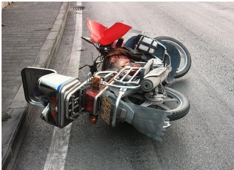
(图2·渝 D5U667 普通二轮摩托车)

渝 D5U667 普通二轮摩托车(图2);品牌型号:重庆牌 CQ150-5; 车辆识别代码:LAPPCK503J0000426;发动机号:10W00426;车辆 所有人:戴**;住址:重庆市涪陵区酒店乡牌坊村1组;使用性 质:非营运;检验有效期截至2025年3月31日;初次登记日期: 2019年3月21日;该车在华安财产保险股份有限公司投保。