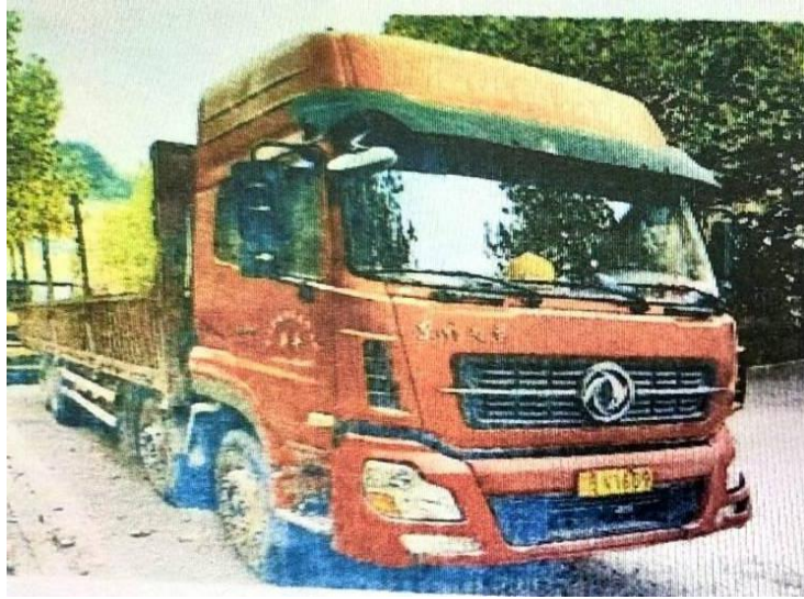
(图1·渝 BV1689 重型仓栅式货车)

渝 D5U667 普通二轮摩托车(图2);品牌型号:重庆牌 CQ150-5; 车辆识别代码:LAPPCK503J0000426;发动机号:10W00426;车辆 所有人:戴**;住址:重庆市涪陵区酒店乡牌坊村1组;使用性 质:非营运;检验有效期截至2025年3月31日;初次登记日期: 2019年3月21日;该车在华安财产保险股份有限公司投保。