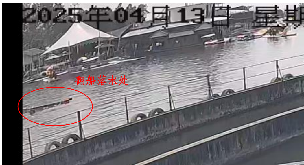
图1 事故现场监控画面

景区开展的水上娱乐项目有：龙舟、竹筏、摩托艇、皮划艇和休闲船（包括仓鼠 [1] 、三轮自行车等）。景区制定有仓鼠船使用说明，仓鼠船出厂时附有厂家合格证。（图3）