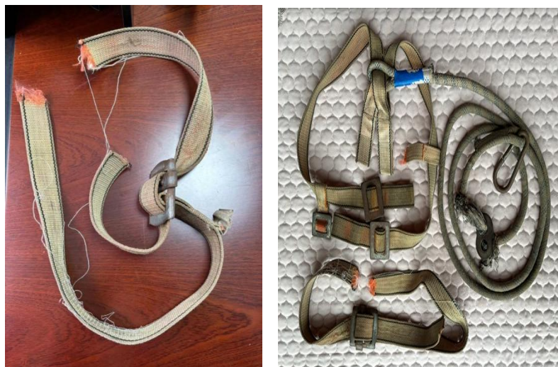
图 5 断裂的安全带、腰带及完整的安全带