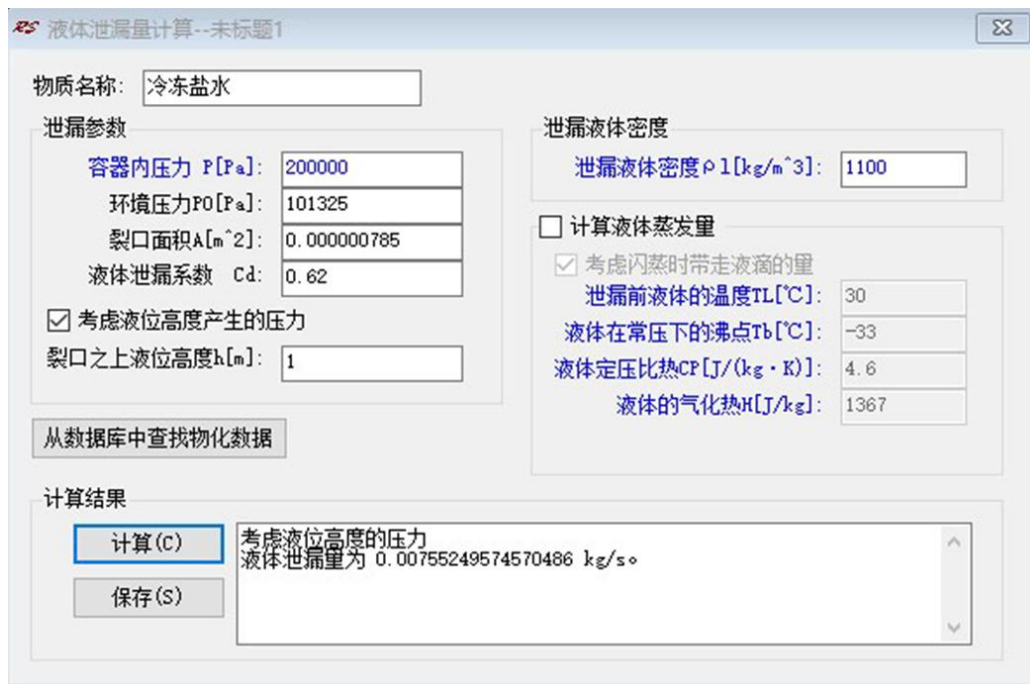
图 9 冷冻盐水泄漏速度计算

根据事故釜冷冻盐水检测分析报告可知，每升冷冻盐水中氨氮总含量为 50mg，其中氨氮总量约为 2200mg。氨氮总量 (2200mg) 与产气釜内的亚硝酸钠量 (367kg) 相比，数量级差较大，亚硝酸钠遇铵盐爆炸可能性较小。结合事故现场着火痕迹勘查，排除亚硝酸钠遇铵盐发生化学反应爆炸可能。