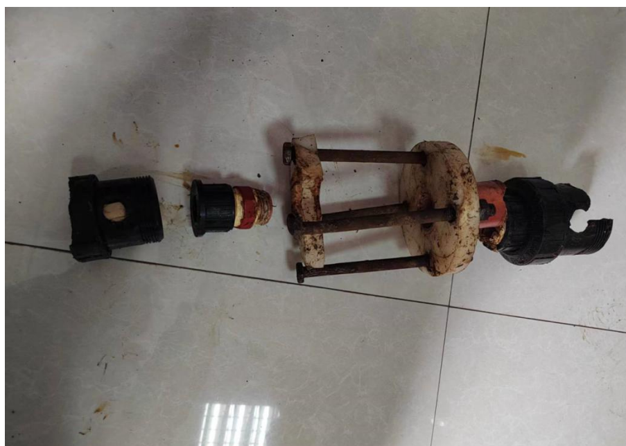
图8 事故调节阀开合状态