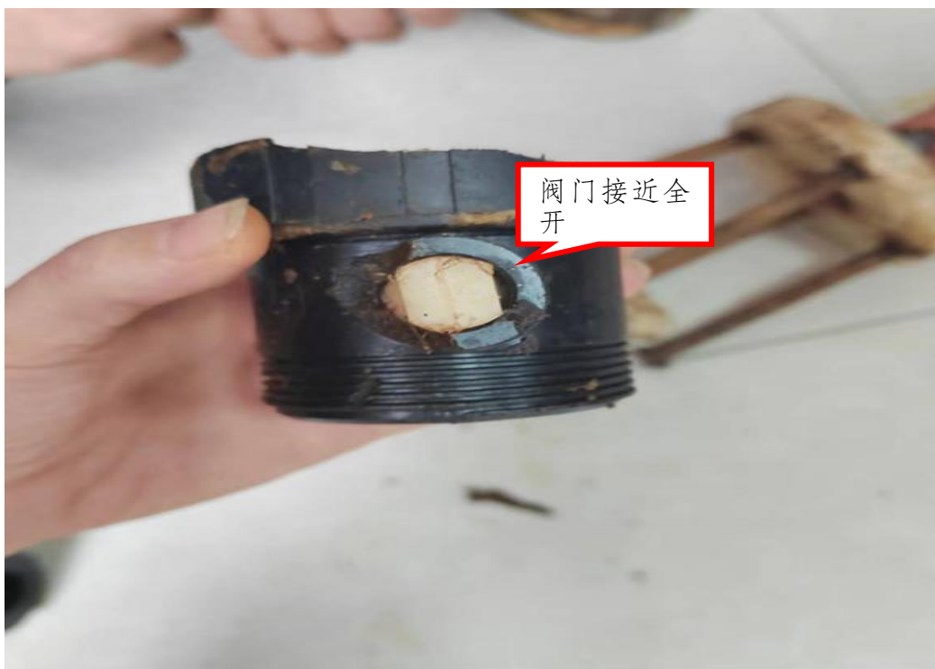
图7 事故反应釜手动调节阀