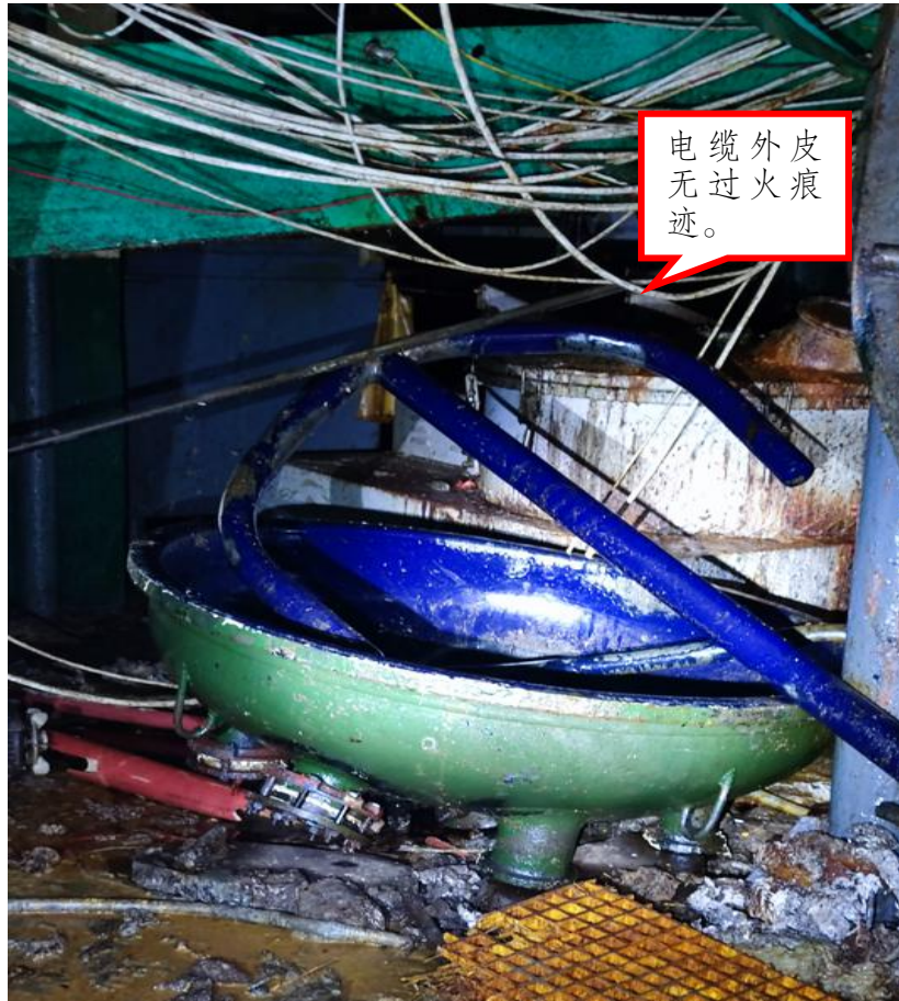
图 6 相邻反应釜无过火痕迹