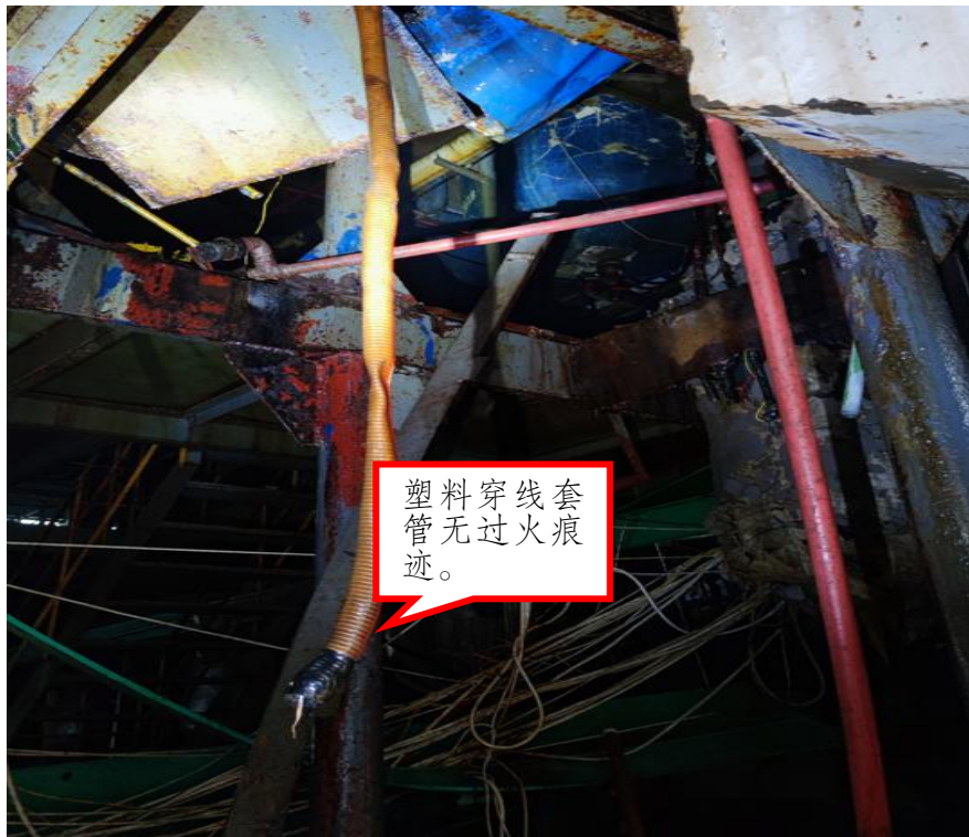
图5 电缆外皮无过火痕迹