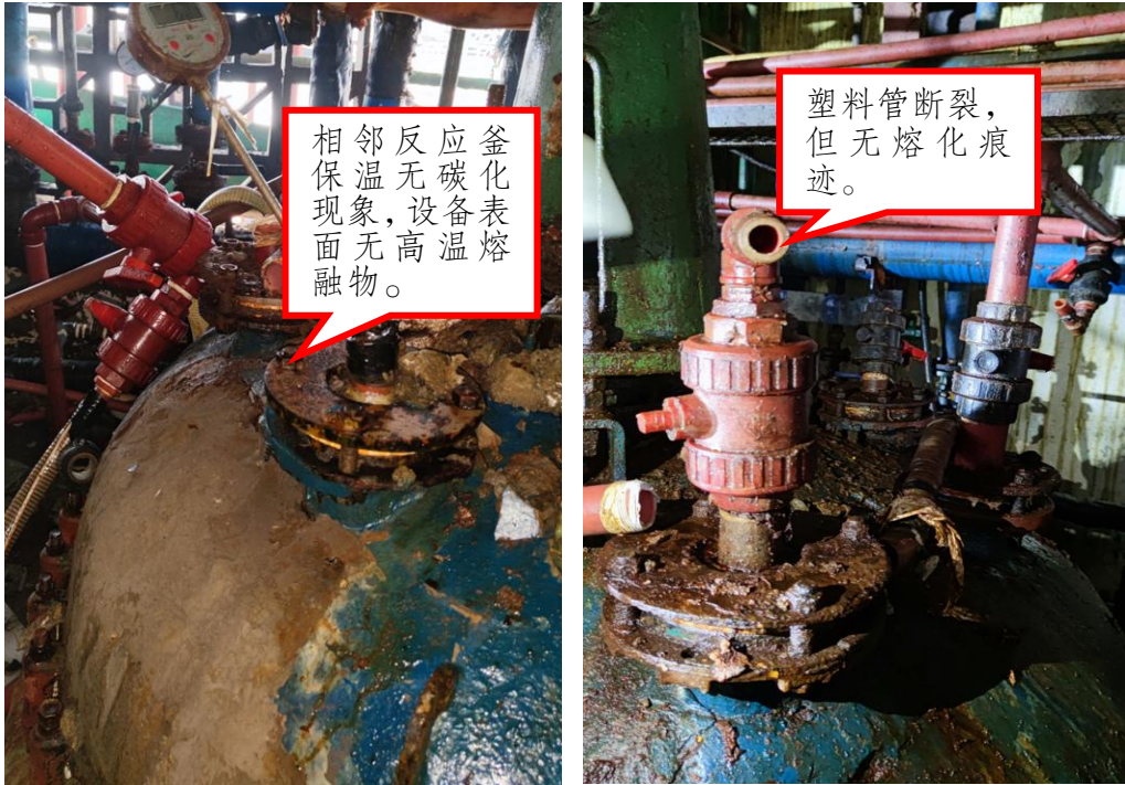
图4 塑料穿线套管无过火痕迹