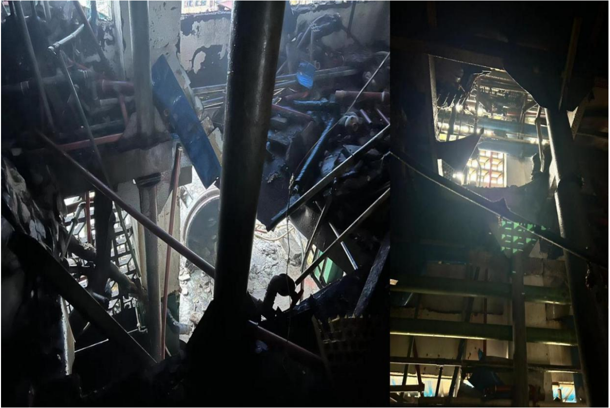
图 1 事故现场照片